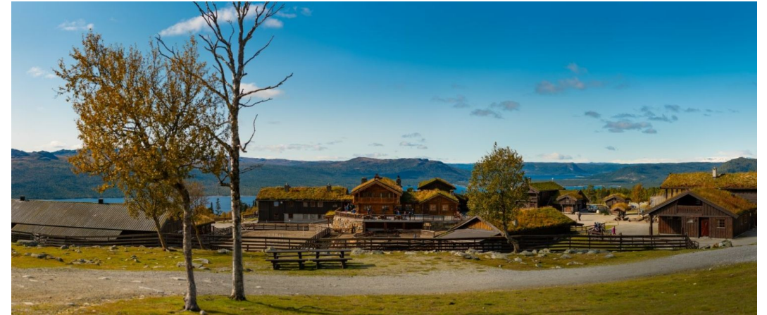
Foto av Langedrag Naturpark